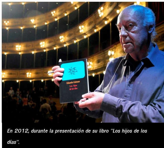
En 2012, durante la presentación de su libro "Los hijos de los días".

¿Sabe callar la palabra cuando ya no se encuentra con el momento que la necesita ni con el lugar que la quiere? Y la boca, ¿sabe morir?